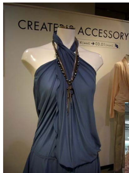
(名古屋松坂屋2010年2月)