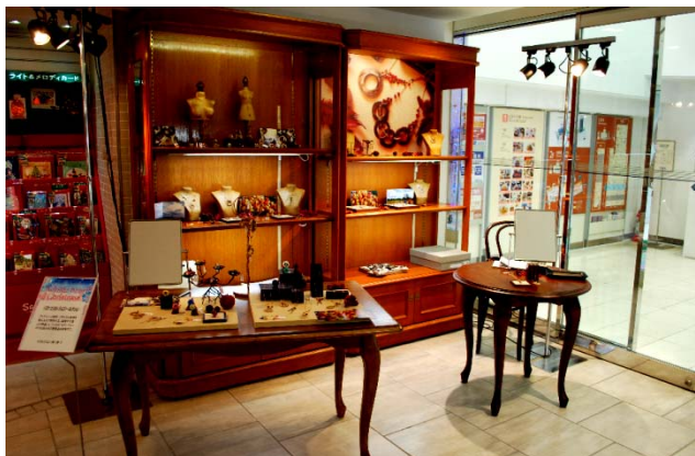
(新宿小田急百貨店 2009年11月・12月)